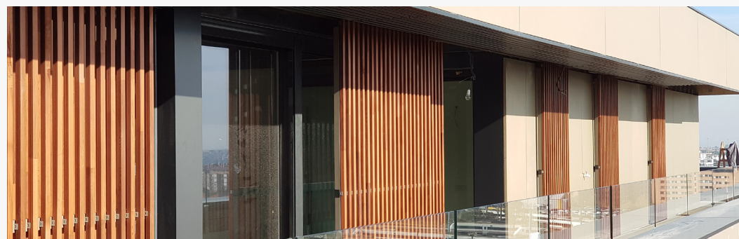
131 Viviendas en Montecarmelo (2018)