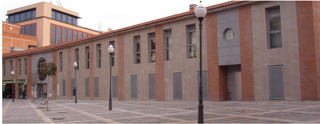
Juzgados Municipales de Móstoles (2007)