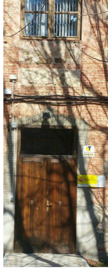
Centro de Montes y Aserradero de Valsain(2016)