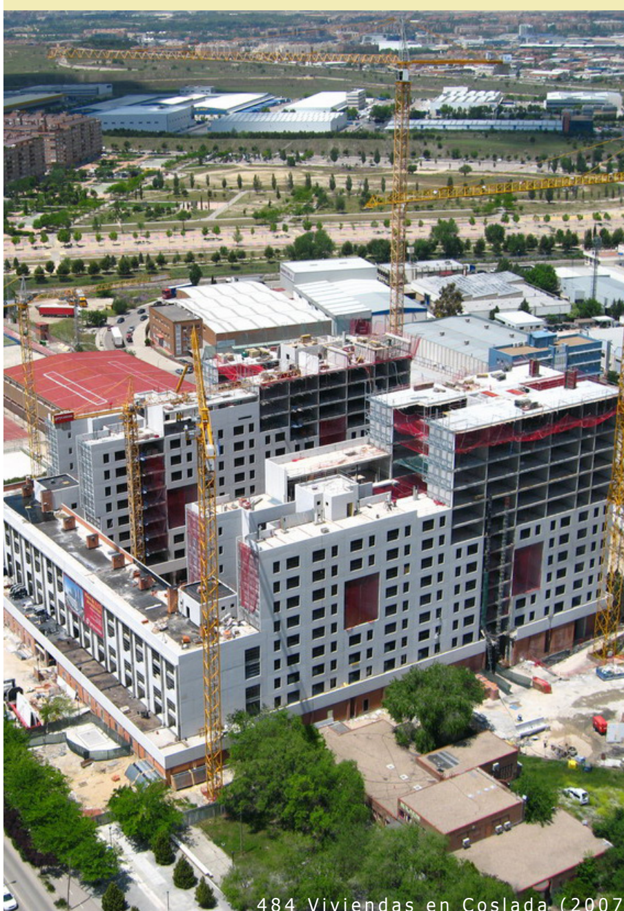
484 Viviendas en Coslada (2007)