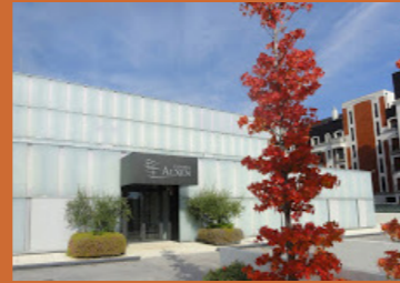
Clínica Axen, Logroño(2010)