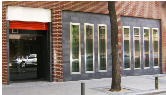
Oficina Judicial Ciudad Lineal (2007)