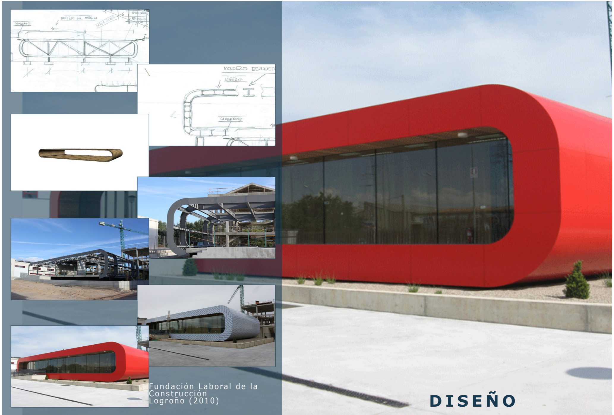
Fundación Laboral de la Construcción Logroño (2010)