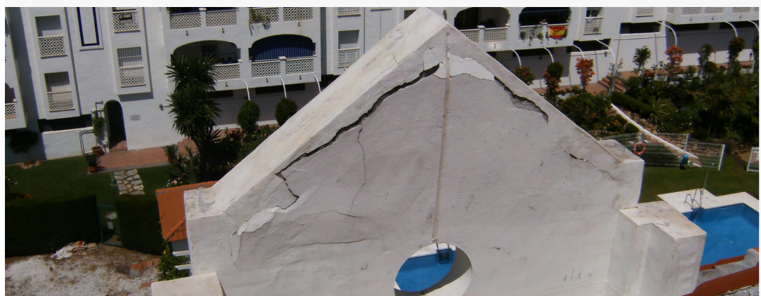
Urbanización "El Arquillo" San Pedro de Alcántara, Málaga(2010)