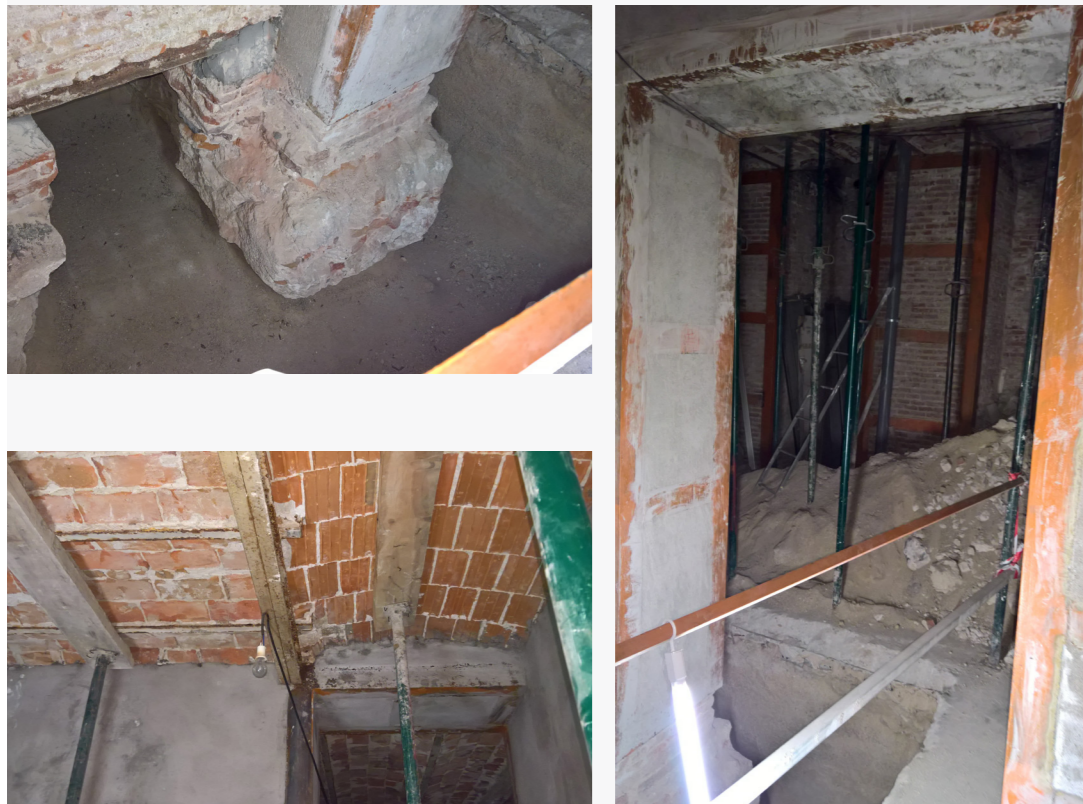
C/ Concepción Jerónima 33, Madrid (2018)