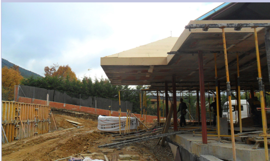
Vivienda Unifamiliar Navacerrada (2014)