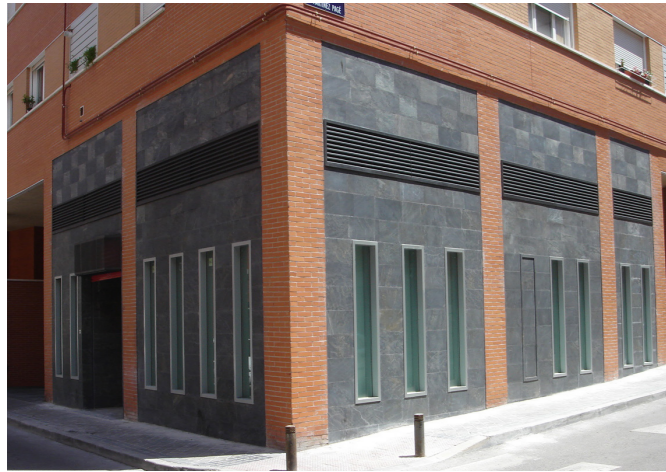
Oficina Judicial Tetuán (2007)