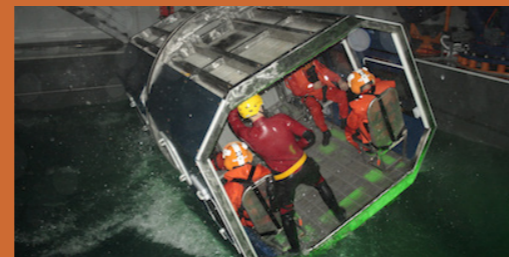
Centro de supervivencia aeronaval Rota (2006)