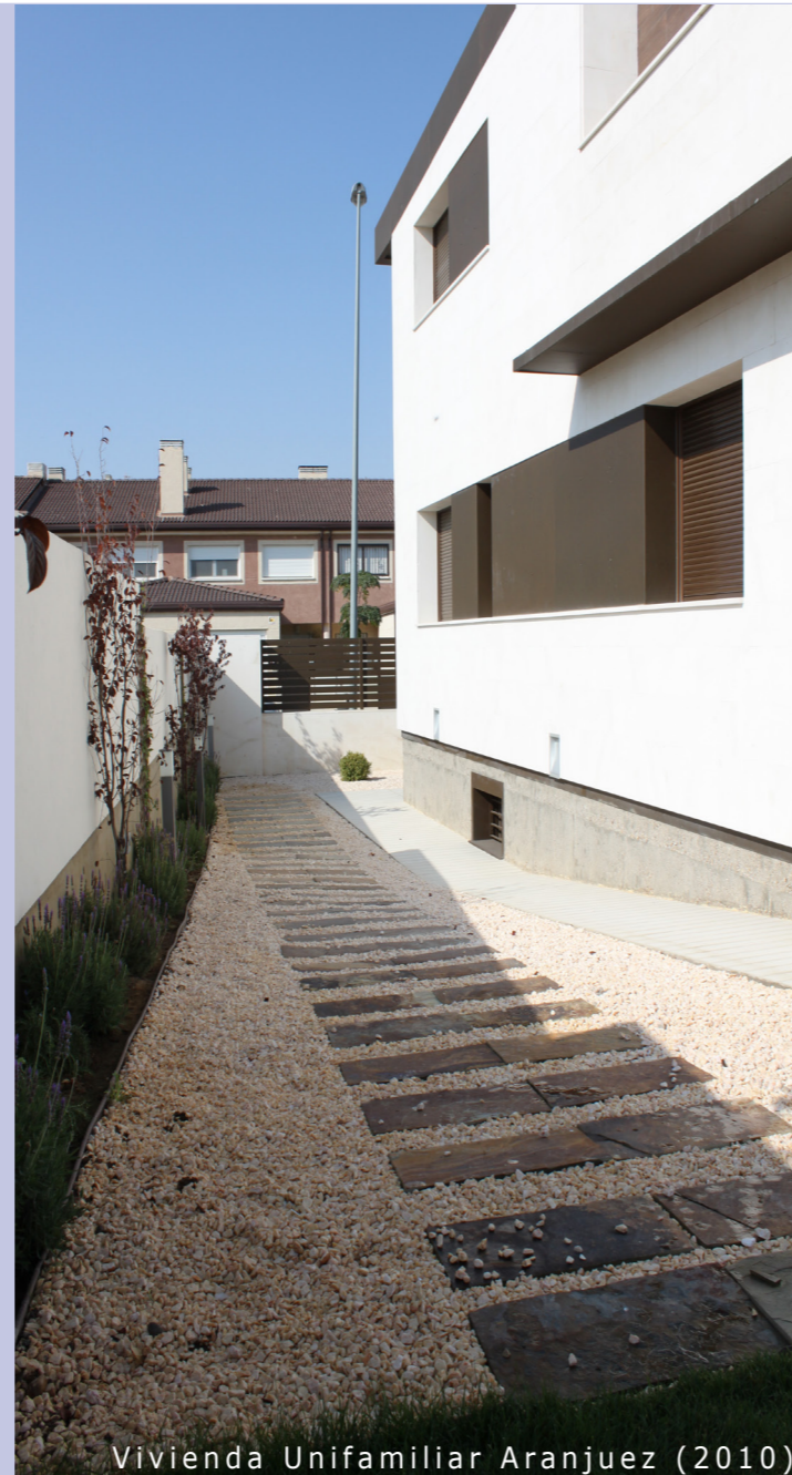
Vivienda Unifamiliar Aranjuez (2010)