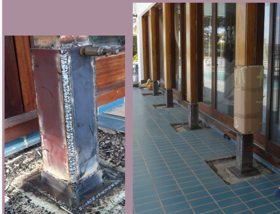
Casa Manantial, Palma de Mallorca (2010)