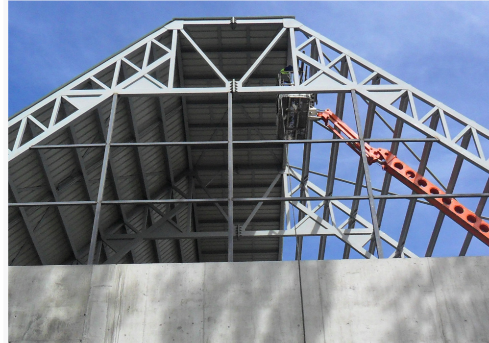
Remodelación de factoría KRONOSPAN, Burgos (2015-2019)